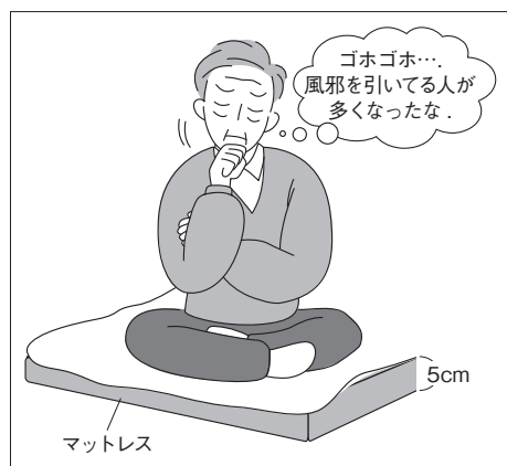
図IV-94 Bさんの寝床の状況

現在は床から5cmの高さに寝ているため(図IV-94)、塵埃やダニ・カビなどに睡眠中にさらされている可能性があります。そこで睡眠中のマスク装着、起床時と食事の際の含嗽と手洗いをすすめました。