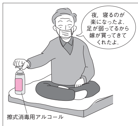
図IV-95 擦式消毒用アルコールを用いたBさんの感染予防

2日後の訪問時、Bさんはマスクをしていました。「夜は少し楽に寝ることができるようになったよ」と言って、医務室で診てもらったら同じようなことを言われたと笑っていました。そして、起床時は、含嗽と手洗いを歯磨きもかねて洗面台まで行って実施していますが、足が弱っているので、その後の手洗いは、薬局で購入した擦式消毒用アルコールで行っているとのことでした(図IV-95)。看護師は、Bさんと家族に継続できる方法を工夫していて、とてもよい、素晴らしいことだと伝えました。